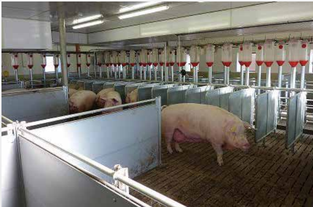
Gruppenhaltung für tragende Sauen mit Fressplatzteiler und Liegenischen