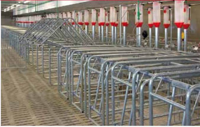
Sauenfressliegebuchten mit Selbstfangwippen für Gruppenhaltung