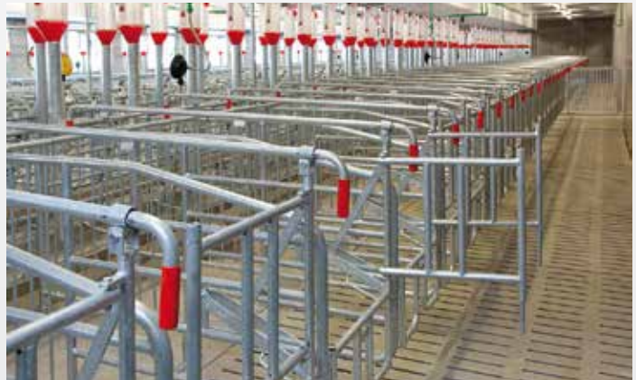
Sauenfressliegebucht für Deckzentrum mit hochklappbaren Türen, von hinten und vorne zu betätigen, mit Besamungstür