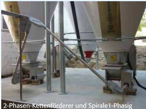
2-Phasen-Kettenförderer und Spirale 1-Phasig