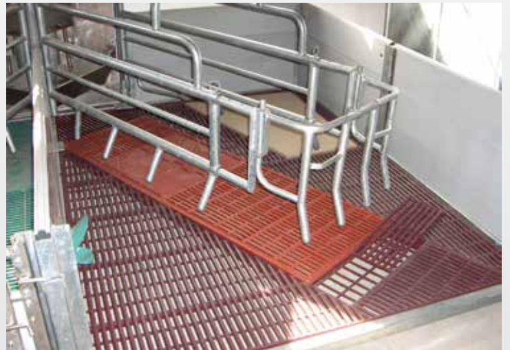
mit plastbeschichtetem Evotek-Doppelstabrost, Heizplatte für Ferkel und Gussrost im Sauenbereich mit Kotabwurfplatte