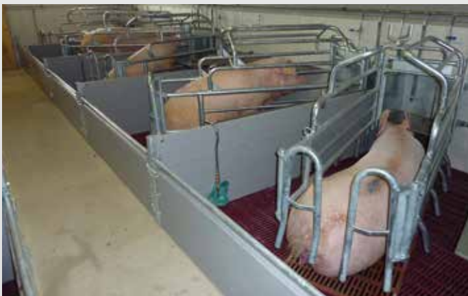
Rückkorb mit Salontüre