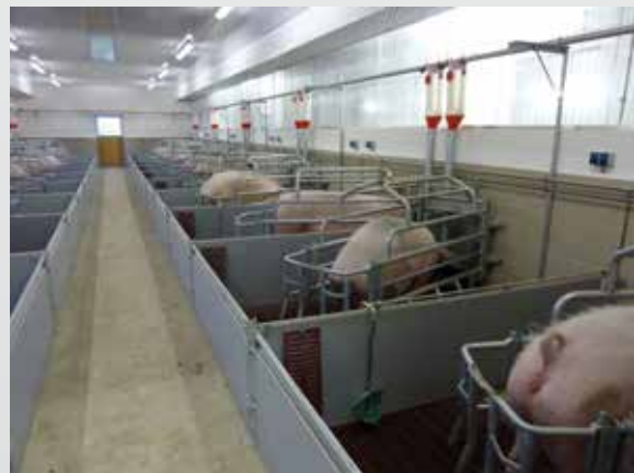
Rückkorb mittig teilbar mit Rohrkettenförderer